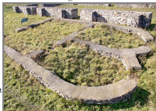
Clădirea cu dublă absidă - sediul ofițerilor.

condiții optime de păstrare a cerealelor, ferindu-le în primul rând de umiditate. În comparație cu alte magazine descoperite în alte castru de dimensiunile celui de la Jidova, aceasta are o suprafață destul de mare - 384 m 2 .